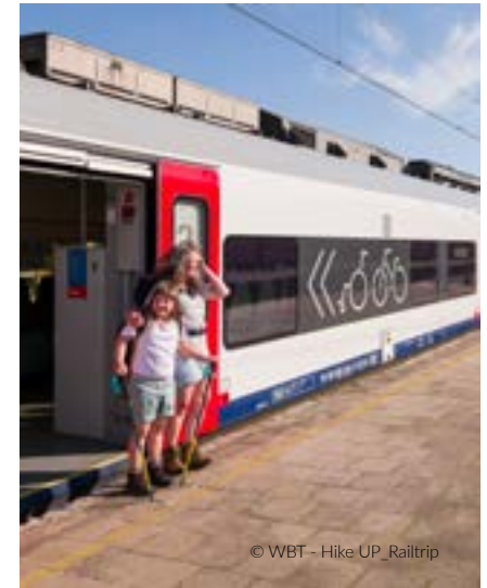
Hike UP_Railtrip