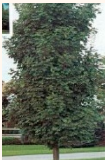
PLANTATIONS DE PLACES : ACER PLATANOIDES 'COLOMNARE'