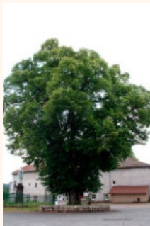
PLANTATIONS ISOLÉES : TILLEUL DE LA LIBERTÉ