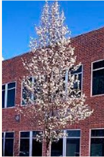
PLANTATIONS CONCENTRÉES : PYRUS CALLERYANA 'CHANTICLEER'