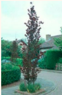
PLANTATIONS PONCTUELLES : FAGUS SYLVATICA 'DAWYCK' ET 'DAWYCK PURPLE'